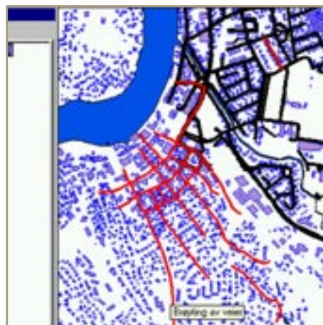
Saltning af veje

Uanset om kommunen selv skal udføre opgaven, eller opgaven løses af en entreprenør, kræves der kontrol og overblik. Flere og flere kommuner vælger bestiller/udfører-modellen. I denne forbindelse får man nemt overblik over, hvem der er ansvarlig - med telefonnummer og evt. billede - eller over hvilke opgaver, der udføres på hvilke veje - eller hvis ruterne skal laves om. Med få tastetryk kan oplysningerne ændres og vises på kort.